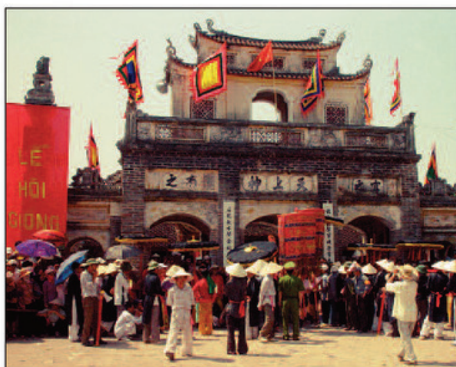
Lễ hội Đền Gióng (Phù Đổng, Gia Lâm, H Nội.)

- Tính đến năm 2005, Việt Nam có Vịnh Hạ Long, Cố đô Huế, Phố cổ Hội An, Di tích Mỹ Sơn, Vườn quốc gia Phong Nha - Kẻ Bàng, Nhã nhạc cung đình Huế, Không gian văn hoá công cộng chiêng Tây Nguyên đã được UNESCO công nhận là di sản thế giới.