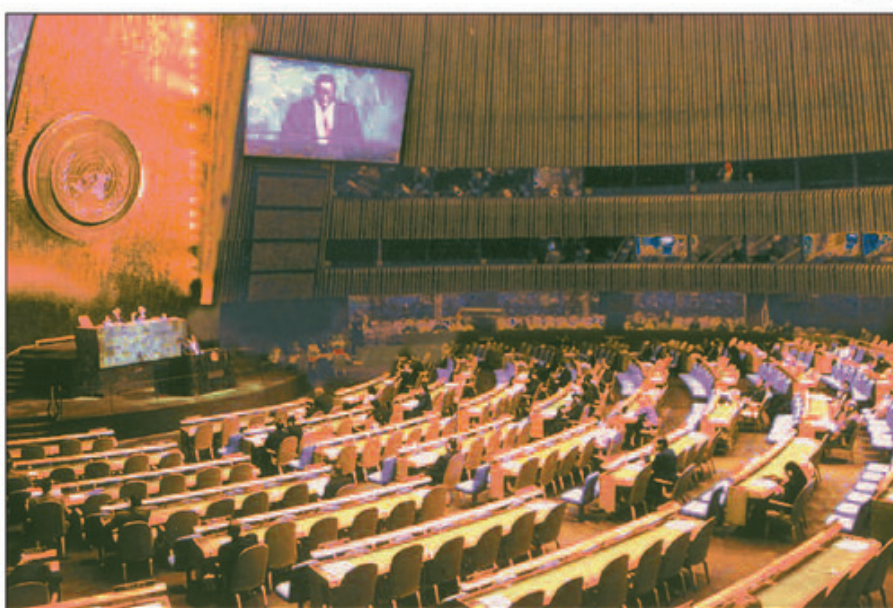
Một phiên họp của Đại hội đồng Liên