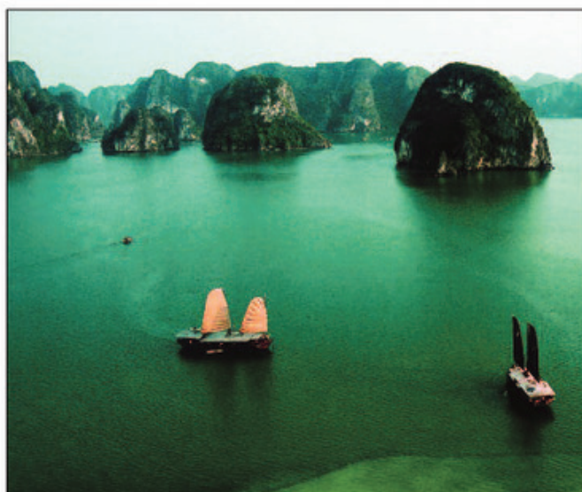
Vịnh Hạ Long