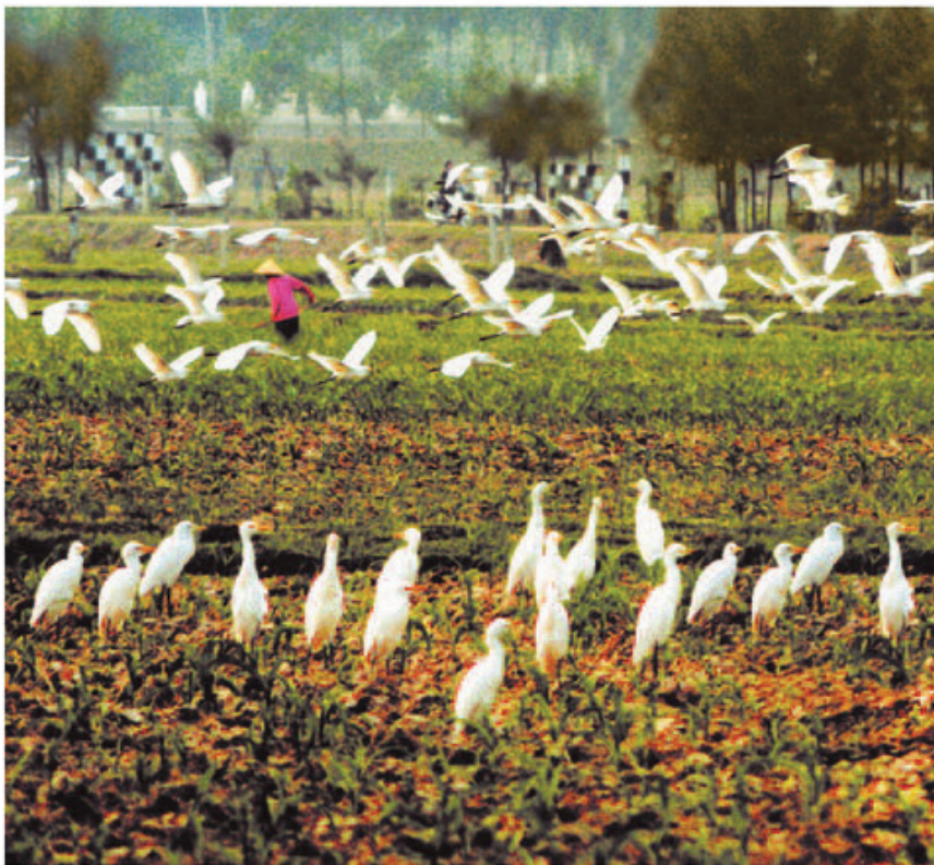
Miền quê thanh bình