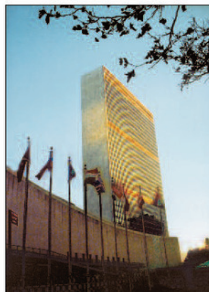
Trụ sở Liên hợp quốc tại Niu Oóc (Hoa Kỳ)

Công ước Quốc tế về Quyền trẻ em đã được Liên hợp quốc thông qua ngày 20 tháng 11 năm 1989.