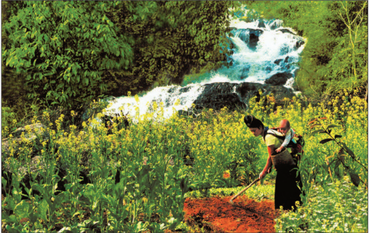
Mẹ điu con / m nông