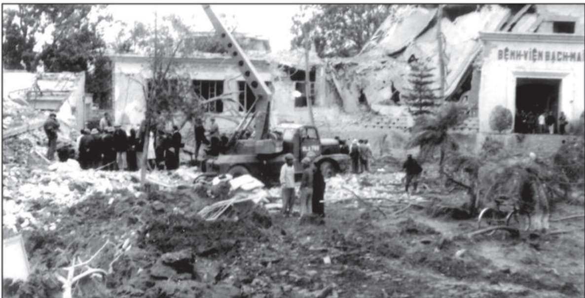
Bệnh viện Bạch Mai (Hà Nội) bị máy bay Mỹ ném bom ngày 26 tháng 12 năm 1972